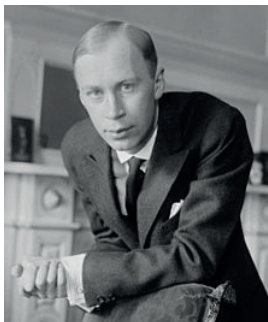
Sonate pour flûte et piano op.94 de Serge Prokofiev