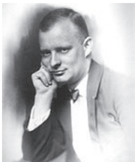
Sonate pour alto et piano, op.11 de Paul Hindemith