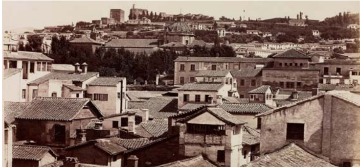
Photographie: Granada, vista de la Alhambra desde la ciudad.