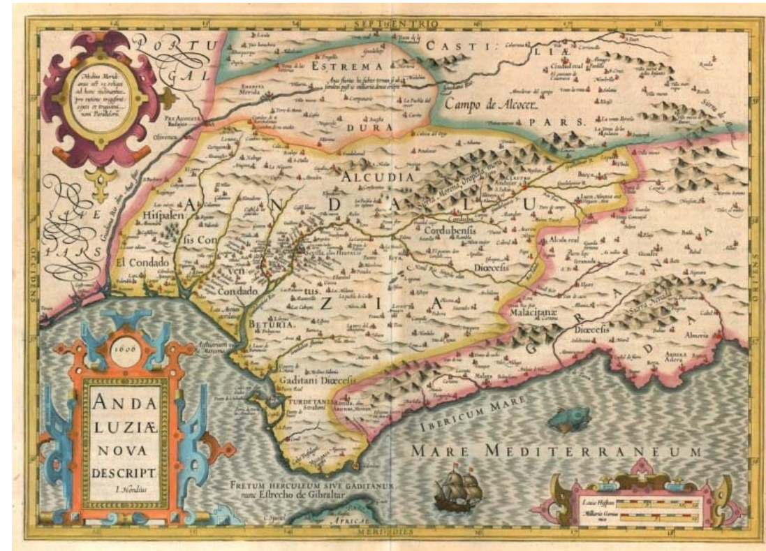
Andalusia nova descript. , Josse Hondius, 1606

Araceli Guillaume-Alonso CLEA 1 / Checla Civilisation et Histoire de l'Espagne Classique