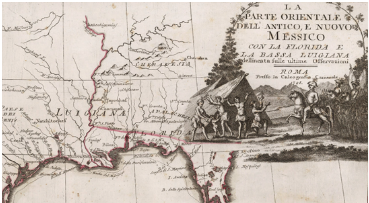
La parte orientale dell'Antico, e Nuovo Messico con la Florida e la lassa Luigiana (detail), Giovanni Maria Cassini, 1798, David Rumsey Historical Map Collection