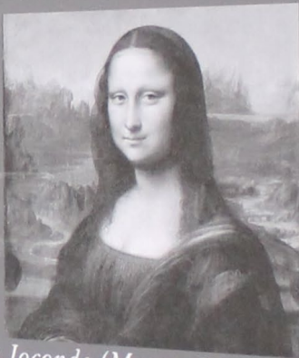
La Joconde (Monna Lisa) Salle 6