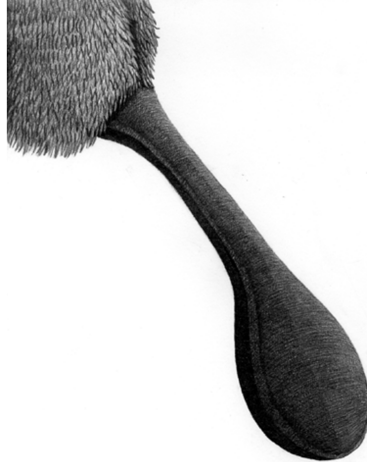
Sin título Sans titre Del proyecto Primer viaje en torno a lo maravilloso Lapiz de grafito sobre papel 29,7 x 42 cm 2020