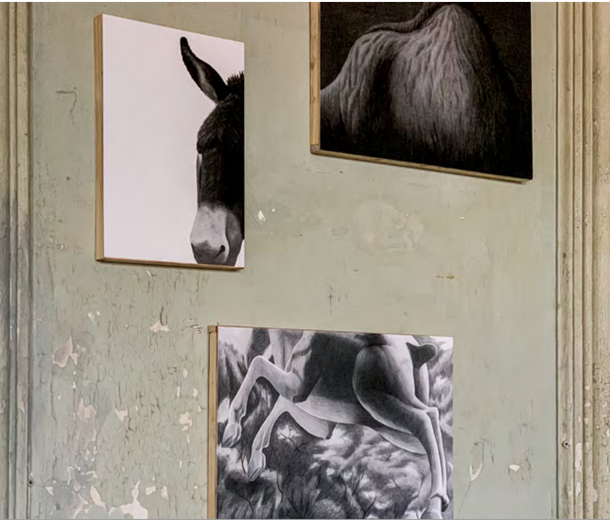
Page 12 Sin título (Quimeras) Sans titre (Chimères) Du projet Premier voyage autour du merveilleux Crayon graphite sur papier 21 x 29,7 cm 2020

Premier Voyage Autour du Merveilleux est avant tout un projet de mémoire réalisé en 2020 par Dylan Altamiranda et prenant pour point de départ les descriptions animalières d'Antonio Pigafetta, marin italien embarqué dans l'équipage du premier tour du monde entrepris et achevé par Magellan entre 1519 et 1522.