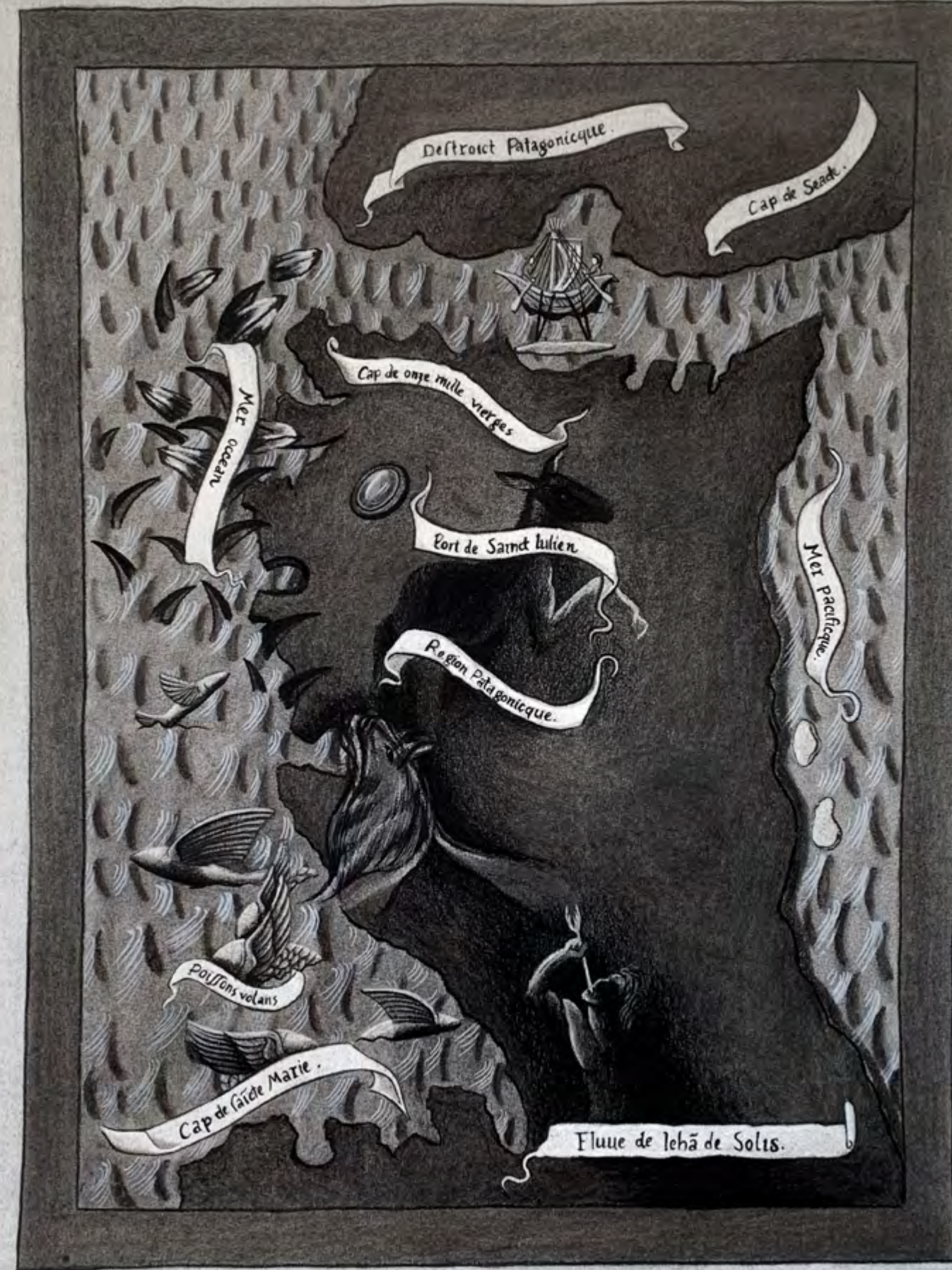
Mapa de Pigafetta Carte de Pigafetta Du projet Premier voyage autour du merveilleux Fusain sur papier 50 x 65 cm 2024