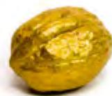
Nuez de oro Noix en or Del proyecto Primer viaje en torno a lo maravilloso Fotografía sobre papel mate 60 x 80 cm 2021