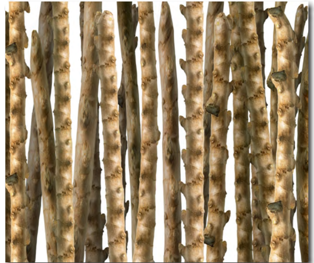
Jengibre Gingembre Du projet Premier voyage autour du merveilleux Photographie sur papier mat 100 x 70 cm 2021