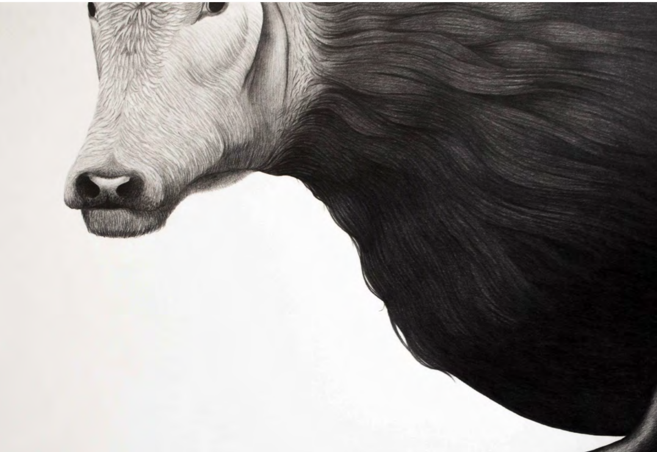
Sin título (Quimeras) Sans titre (Chimères) Du projet Premier voyage autour du merveilleux Crayon graphite sur papier 29,7 x 42 cm 2020