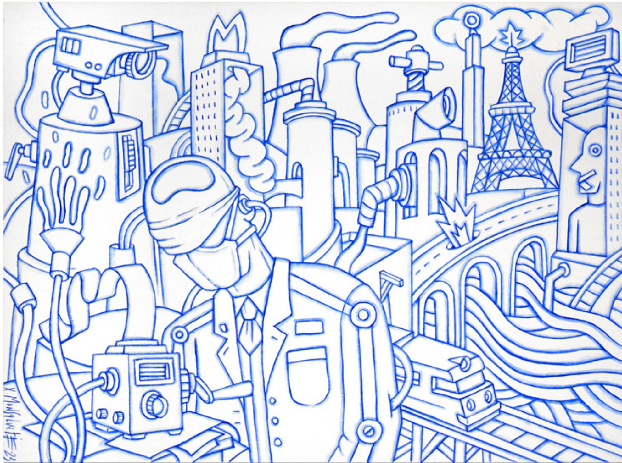
Paris Paris Aquarelle sur papierCanson 28 x 38 cm 2023