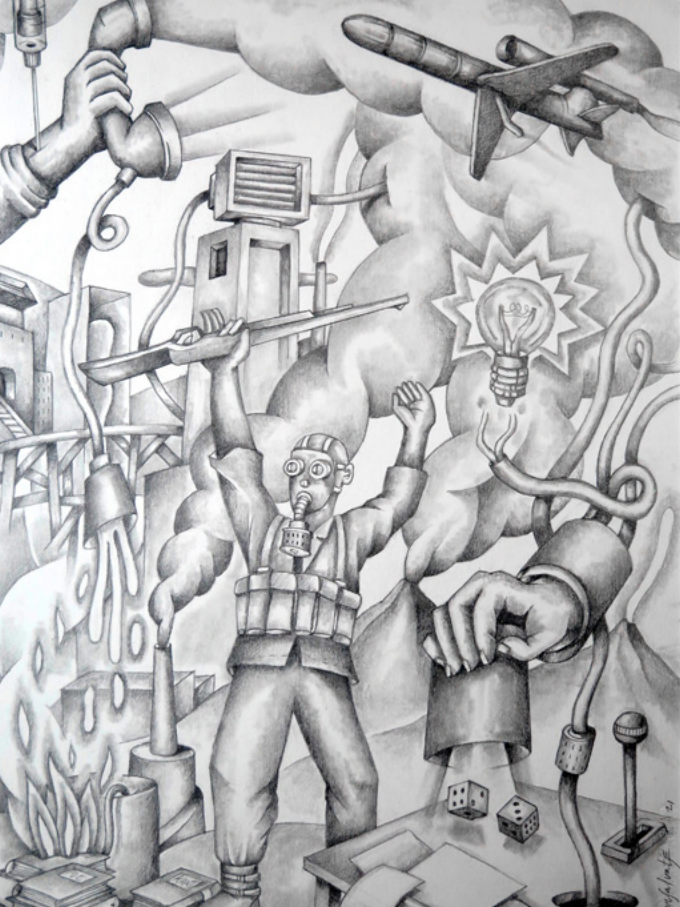
La llamada equivocada L'appel erroné Crayon sur papier C aballo300 grs. 28 x 38 cm 2023

On estime à 100 000 le nombre d'habitants d'Athènes qui ont succombé aux deux vagues épidémiques de 430 et 427 avant notre ère. Socrate tombe malade et se rétablit, ce qui ne fut pas le cas de Périclès qui décède. Certains ont interprété cela comme la punition des dieux pour la guerre injuste contre Sparte, comme une maladie d'origine divine présente dans l'air et transmise par la respiration. Thucydide l'a raconté dans son ouvrage « Histoire de la guerre du Péloponnèse », sans recourir aux dieux, comme la peste (loimós) qui a débuté en Éthiopie. D'après cette histoire, Jack Gold a réalisé le film « La guerre sans fin » (1991). En effet, les guerres ne finissent jamais, que ce soit entre les hommes, ou des hommes contre les virus. Le 12 juin 2022 de notre ère, on estime à 6,3 millions le nombre de personnes décédées des suites de la pandémie de la COVID-19, pandémie en provenance d'Asie et considérée comme d'origine animale. Une autre pandémie d'origine humaine, trop humaine, envahit nos vies, et ce n'est pas un virus biologique. Et aucun animal n'est à blâmer.