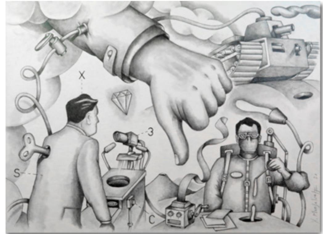
La Victoria engañosa La trompeuse Victoire Crayon sur papier Caballo 300grs 28 x 38 cm 2023

Las respuestas pueden llegar desde el mismo lenguaje. El lenguaje entendido como capacidad para poder pensar y como medio articulado para poder comunicar. El lenguaje que, en tanto resorte esencial que activó nuestra conciencia, se convierte en el vehículo inexorable de la acorazada impunidad en el que podemos desplazarnos.