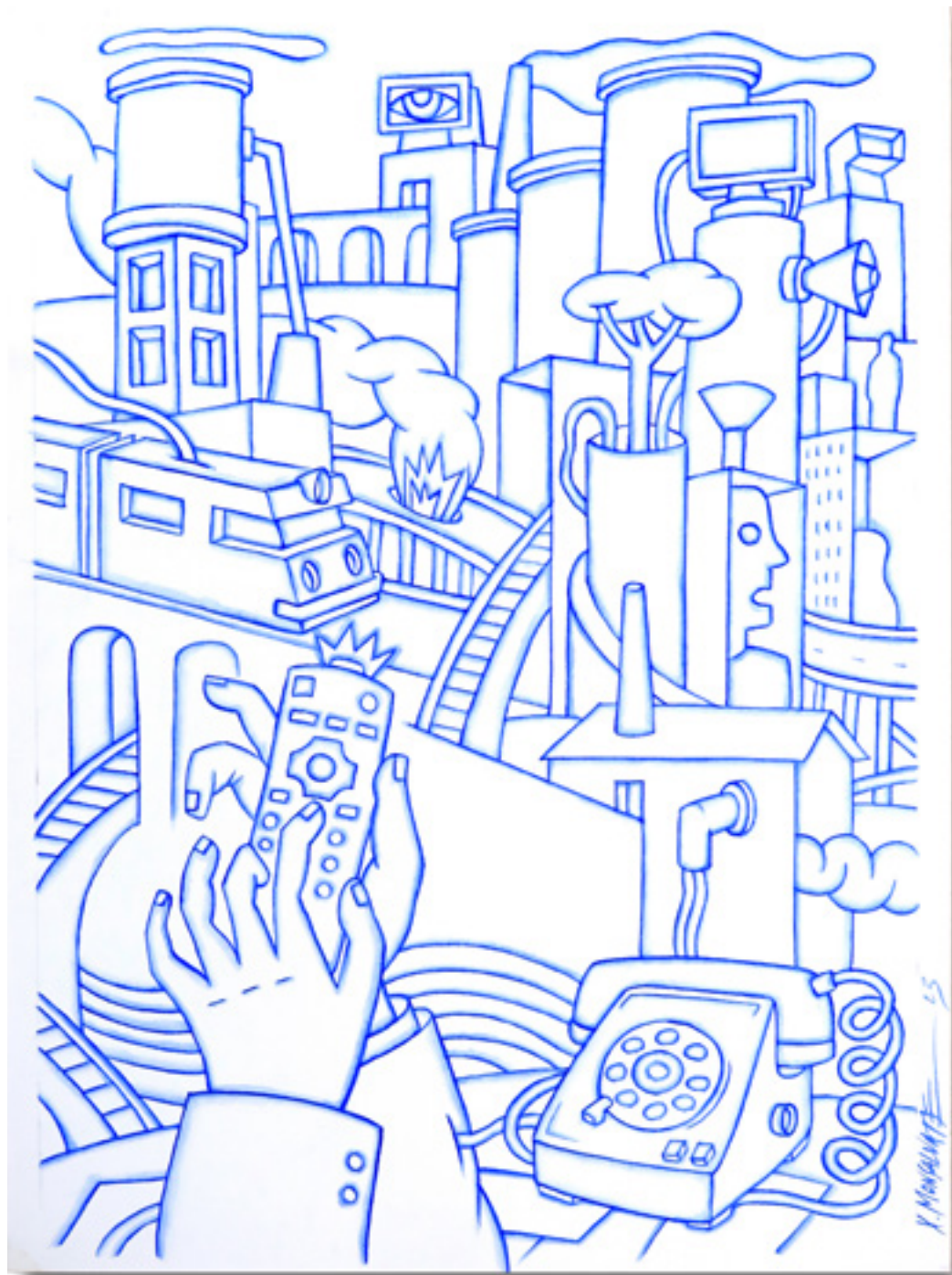
Bajo control Sous contrôle Aquarelle sur papier Canson 28x38 cm 2023