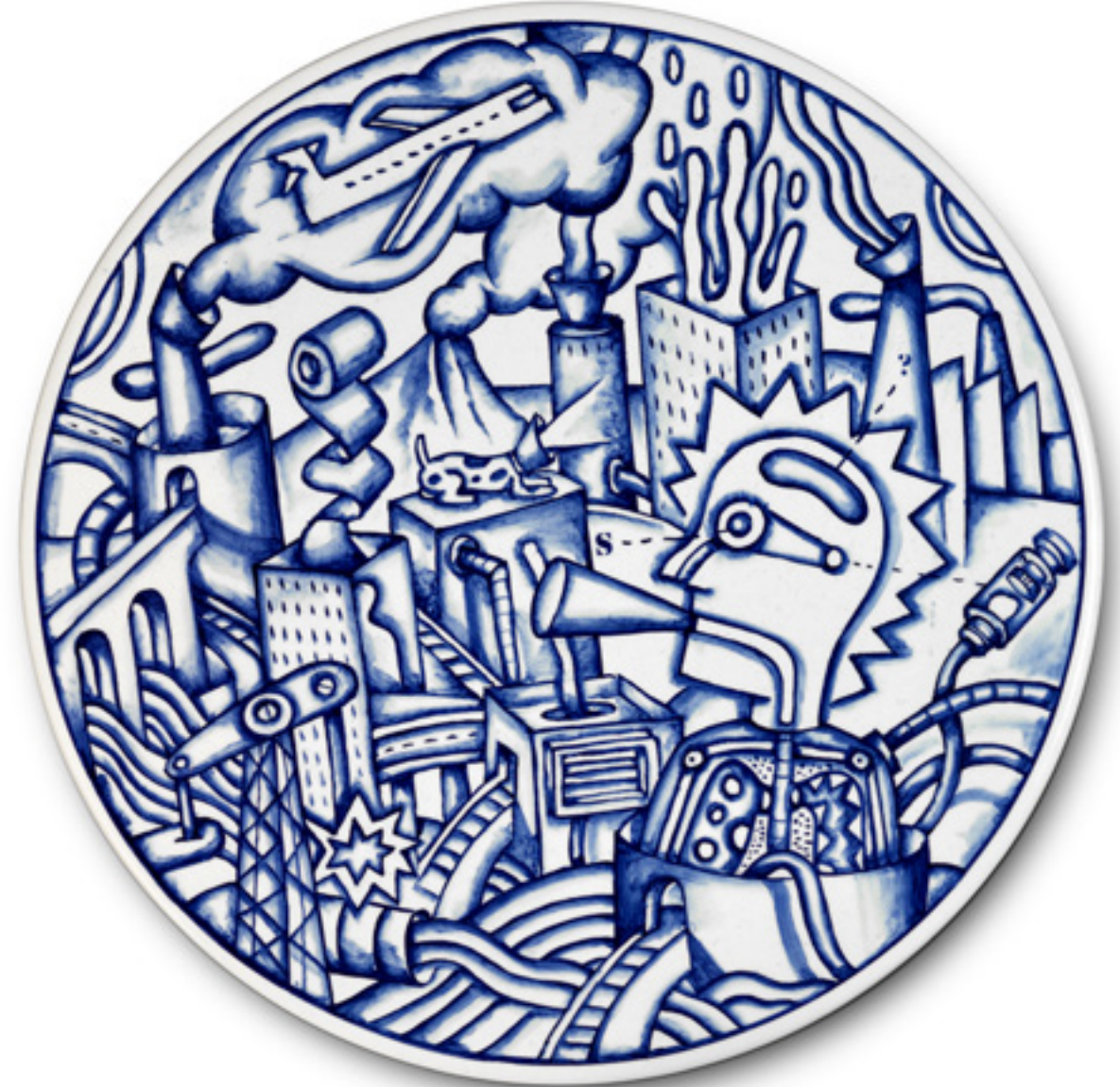
La ciudad del kaos II La ville du Kaos II Plat en faïence 2,5 x 35 Ø cm. Bleu de cobalt sous glaçure 2023