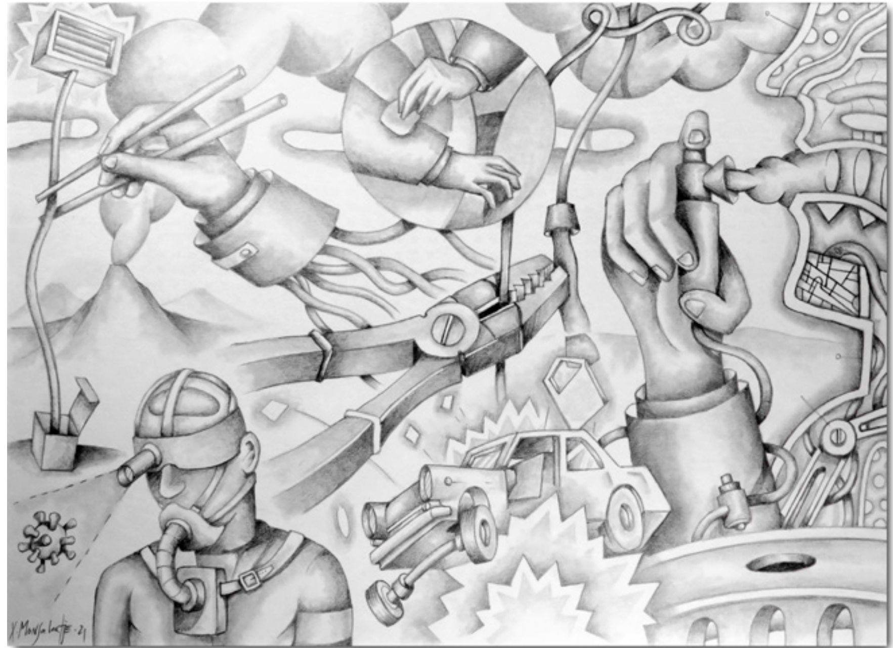
Asthmatic System Système asthmatique Crayon sur papier Caballo 300grs 28 x 38 cm 2023