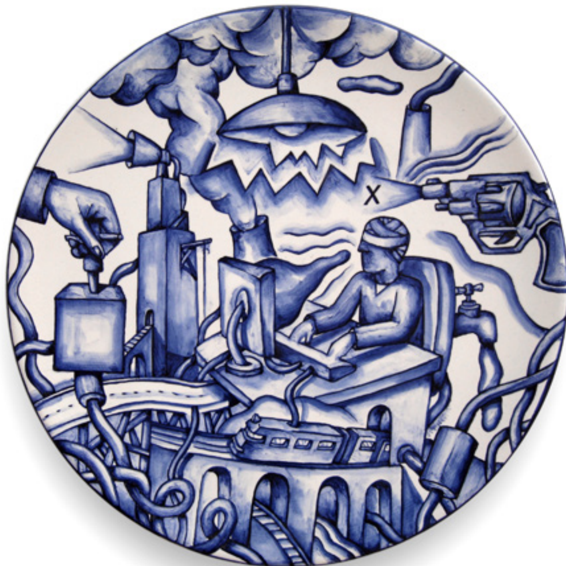
Línea de Fuga Ligne de Fuite Plat en faïence 2 x 40 Ø cm. Bleu de cobalt sous glaçure 2007

Les trois caractéristiques d'une pandémie sont: son universalité, sa vitesse de propagation et son aspect le plus sombre: l'extension du mal.