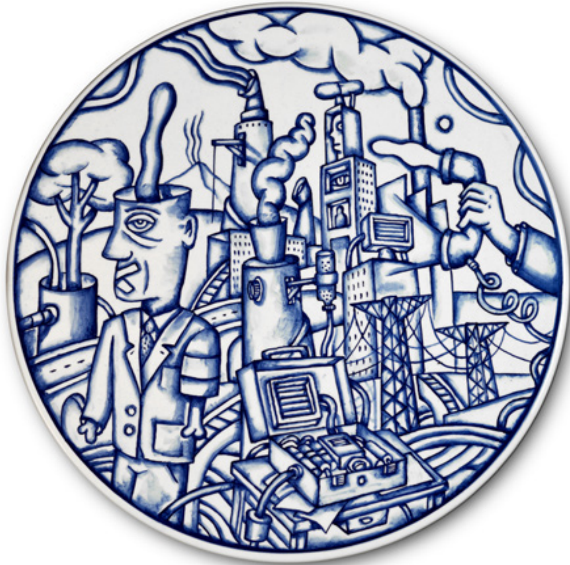
El Insomnio del Poder II L'Insomnie du Pouvoir II Plat en faïence 2,5 x 35 Ø cm. Bleu de cobalt sous glaçure 2023