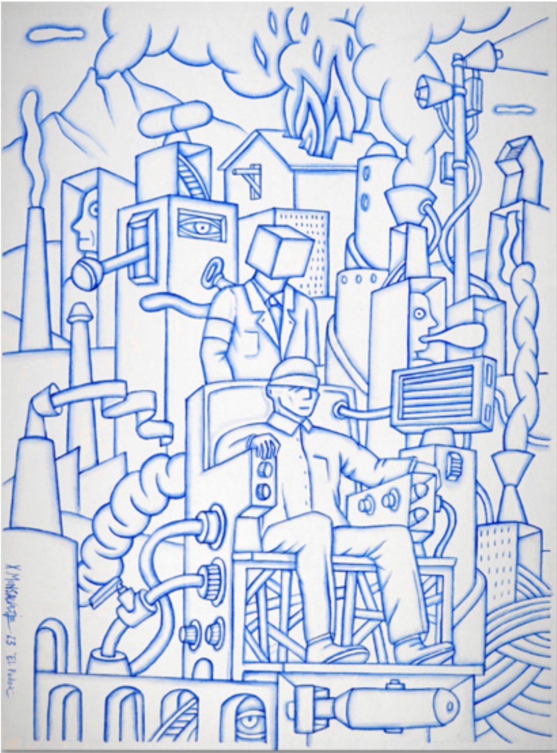
El poder Le Pouvoir Aquarelle sur papier Canson 28 x 38 cm 2023