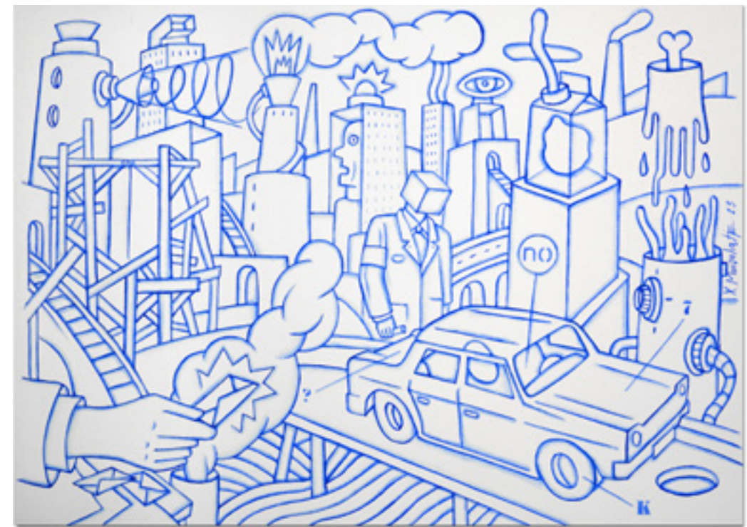
Soborno Pot-de-vin Aquarelle sur papier Canson 28 x 38 cm 2023