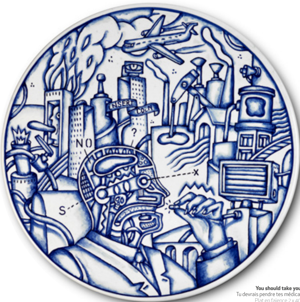
You should take your pills Tu devrais pendre tes médicaments Plat en faïence 2 x 40 Ø cm. Bleu de cobalt sous glaçure 2023

Pero, ¿qué ocurre cuando los individuos no son conscientes de su falta de libertad, porque no la desean? Ya no es necesario controlar los motivos y los anhelos. Mecanismos más sutiles de los sistemas sociales actuales, más que el refuerzo positivo de Skinner, consiguen borrar todo atisbo de reflexión. Intervienen en los órganos esenciales del ser humano: el cerebro y la mano.