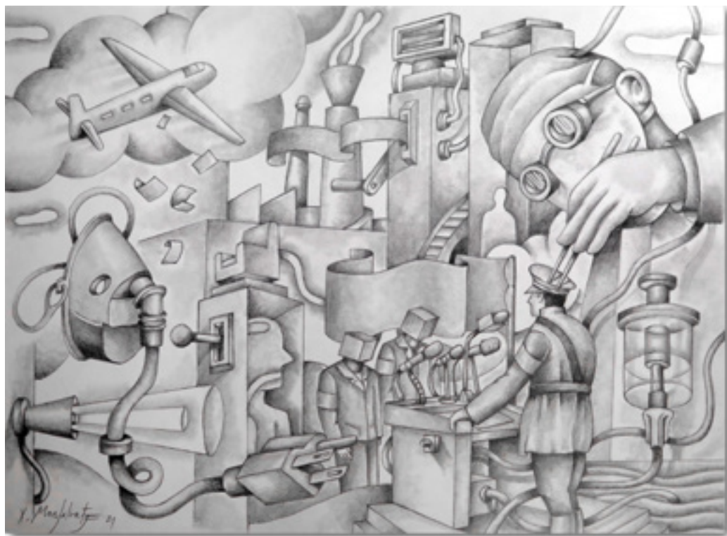
Puppet Poupée Crayon sur papier Caballo 300grs 28 x 38 cm 2023

Mais que se passe-t-il lorsque les individus ne sont pas conscients de l’absence de liberté, parce qu’ils ne la désirent pas? Il n’est alors plus nécessaire de contrôler les motivations et les désirs. Des mécanismes plus subtils des systèmes sociaux actuels, plutôt que le renforcement positif de Skinner, parviennent à effacer toute velléité de réflexion. Ils interviennent dans les organes essentiels de l’être humain: le cerveau et la main.