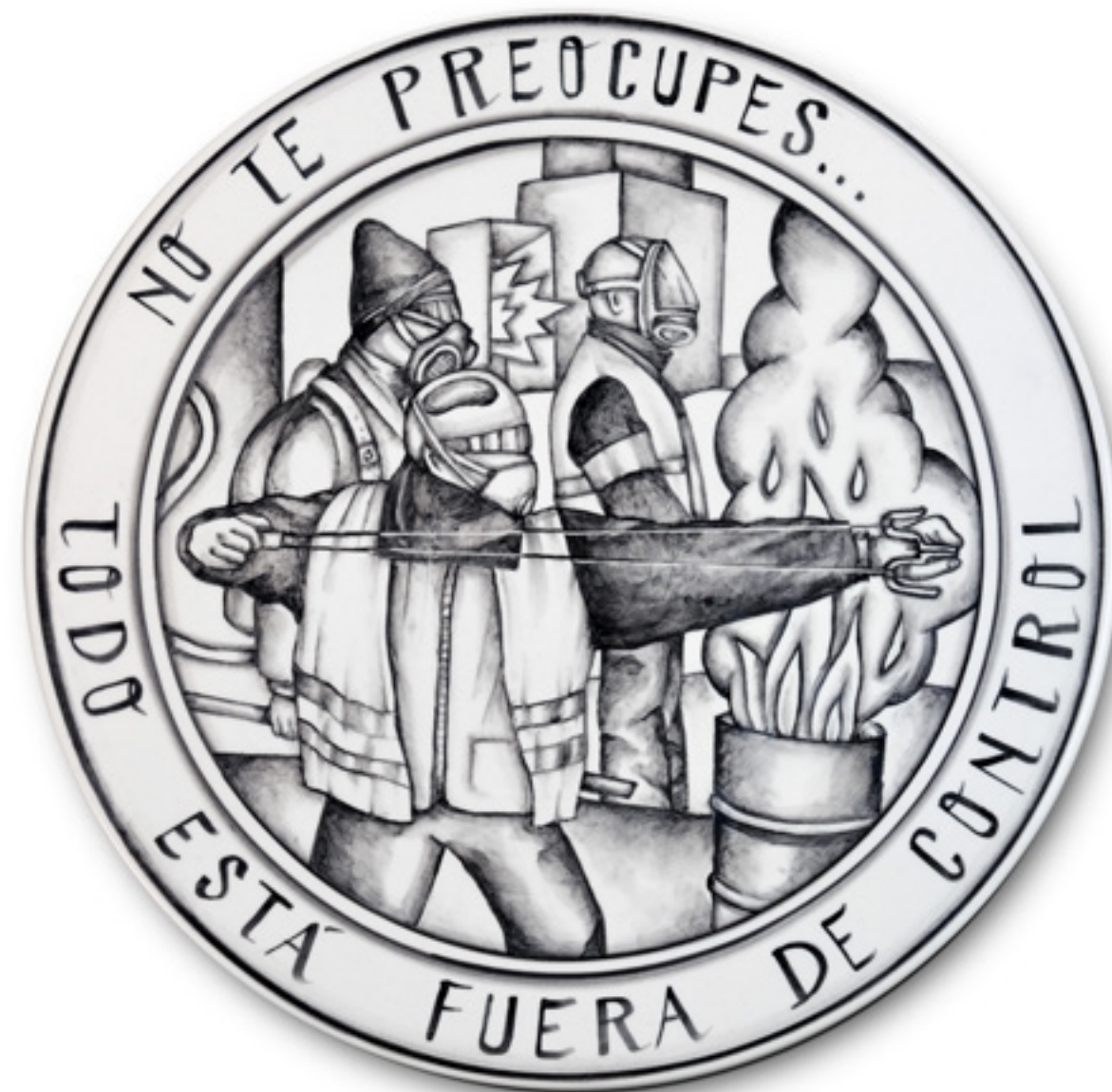
No te preocupes Ne t'inquiète pas Plat en faïence 2x 40 Ø cm. Pigment noir sous glaçure 2023

Dans la langue, donc, servilité et pouvoir se confondent inéluctablement. Si l'on appelle liberté non seulement la puissance de se soustraire au pouvoir, mais aussi et surtout celle de ne se soumettre à personne, il ne peut donc y avoir de liberté qu'en dehors du langage."