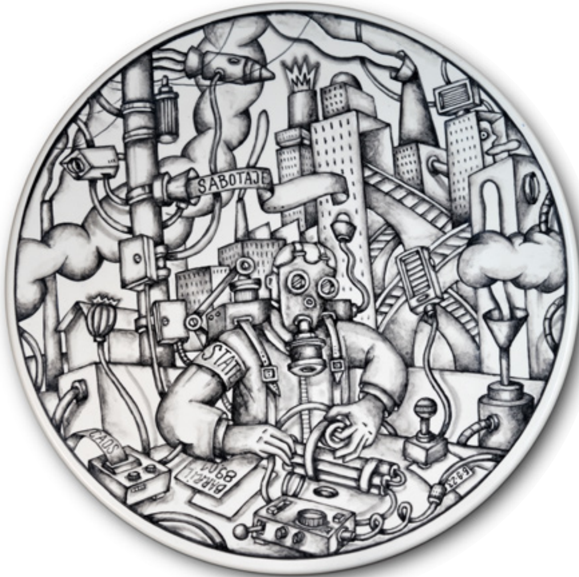
En el caos no hay error Dans le chaos il n'y a pas d'erreur Plat en faïence 3 x 40 Ø cm. Pigment noir sous glaçure 2023