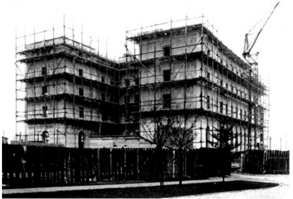
Estado de las obras, diciembre 1930