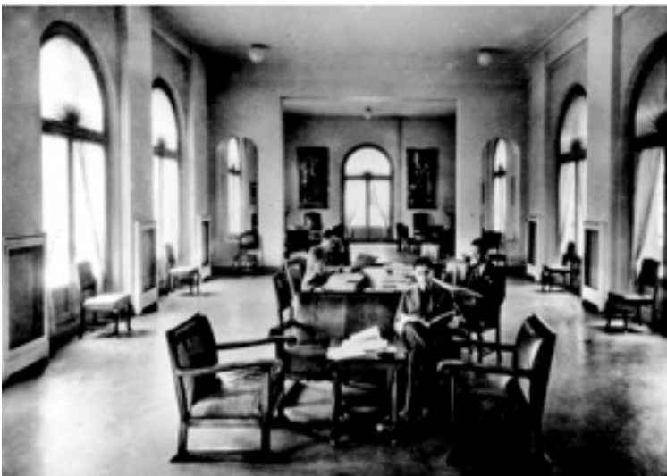
Salón de residentes

Al empezar la Guerra Civil, el gobierno español cesa de enviar los fondos necesarios para el funcionamiento del Colegio. El Colegio de España queda bajo la tutela del gobierno francés y de la Fondation Nationale . En esta época se acoge a exiliados anónimos e ilustres, como Pío Baroja, Blas Cabrera, Severo Ochoa y Javier Zubiri, entre otros.