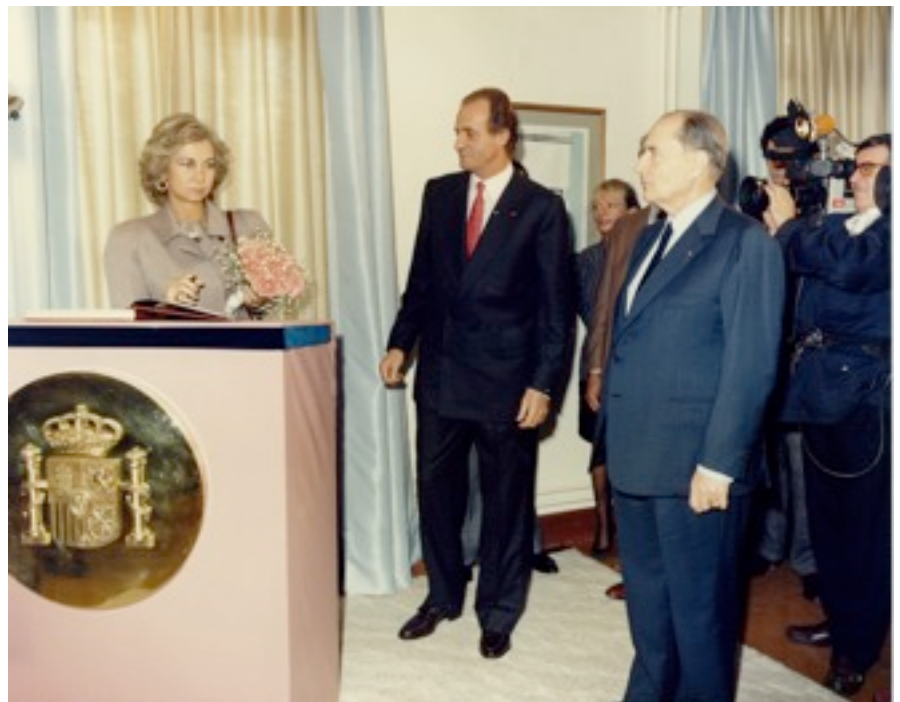
Inauguración del Colegio por SS. MM. Los Reyes de España y el Presidente de la República Francesa, 16.10.1987

Los Reyes de España, Don Juan Carlos y Doña Sofía y el Presidente de la República Francesa, François Mitterrand, acompañados del Ministro de Educación español, José María