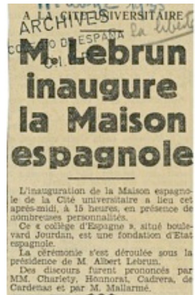
Artículo de «La Liberté», 11.4.1935

Con motivo de la inauguración se organizan una serie de conferencias. Así, Miguel de Unamuno habla del "Destino de España y universalidad de su habla" y Blas Cabrera de "La evolución en el mundo inorgánico" .