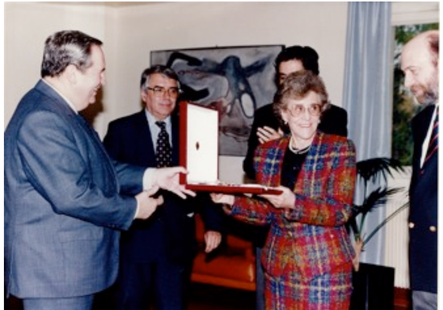
Entrega de la Placa de Honor de la Orden Civil de Alfonso X el Sabio al Colegio de España por el Ministro de Educación y Ciencia, 26.10.1995

El Colegio de España de acuerdo con el espíritu de la Cité Internationale Universitaire de París, y con su propia misión fundacional, realiza una triple función: en primer lugar, el Colegio es residencia de profesores, investigadores, artistas y e s t u d i a n t e s universitarios. Además, promueve la difusión de la ciencia, la cultura y el arte españoles y, más específicamente, las actividades científicas e investigadoras desarrolladas por las Universidades y Centros de investigación españoles. En tercer lugar, el Colegio de España trata de fomentar las relaciones de intercambio internacional vinculadas a esos objetivos.