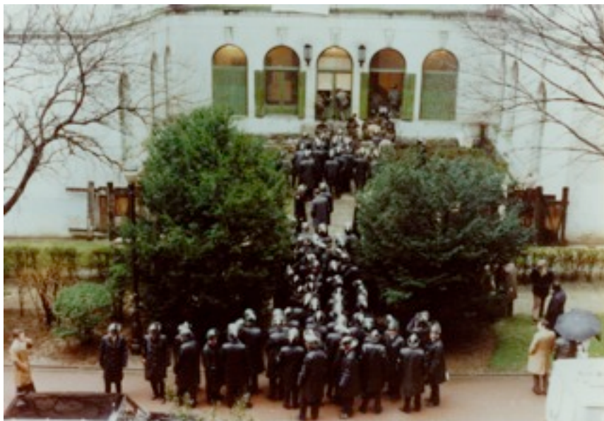
Intervención de la policía para desalojar a los ocupantes, 16.3.1975

En numerosas ocasiones, el Délégué Général de la Cité Universitaire propone a la Embajada de España diversas fórmulas para permitir la reapertura del Colegio sin llegar a ningún acuerdo. El Gobierno español quiere una garantía del Estado francés por la cual se comprometería a hacerse cargo de los desperfectos en caso de nuevos disturbios.