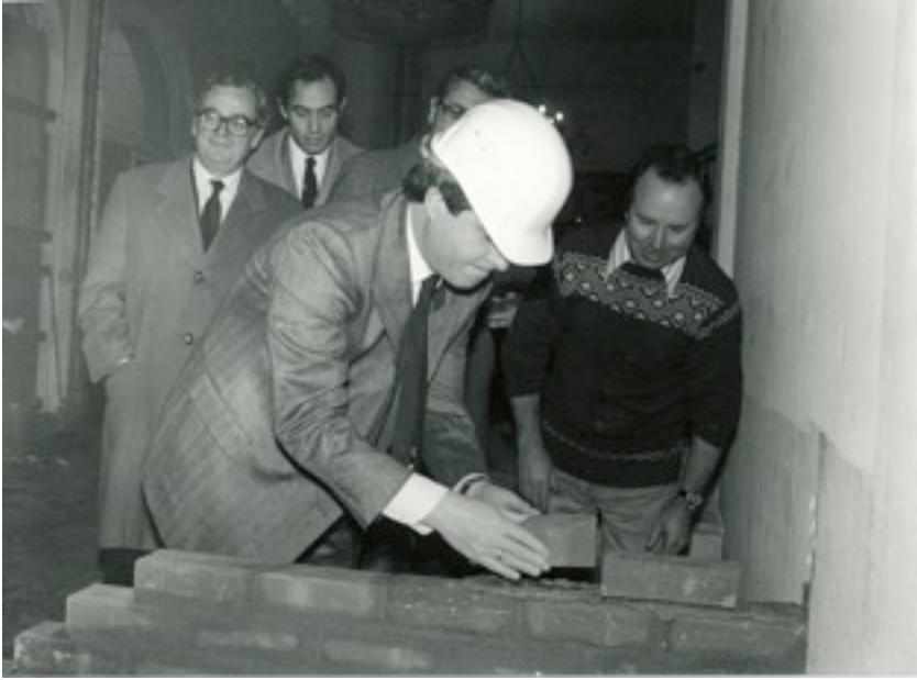
Comienzo de las obras de restauración del Colegio, 4.12.1985

En 1975, el descontento de los estudiantes españoles es cada vez más evidente. Se vuelven a producir dos ocupaciones del edificio en el intervalo de diez días. La policía interviene desalojando a los ocupantes. Unos meses más tarde, un incendio deteriora aún más el estado del Colegio.