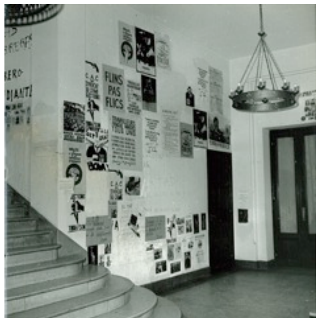
Estado del Colegio después de la ocupación, Mayo del 68

Durante todo el periodo se desarrollaron un número considerable