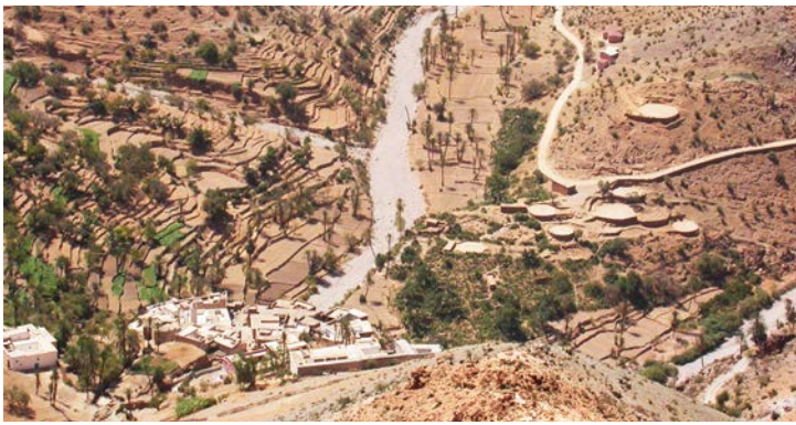
Village de Tughmart, Anti-Atlas, Maroc

Dans le monde de l'islam médiéval, les espaces ruraux sont marqués par une très profonde disparité des moyens de connaissance. En Égypte, les campagnes et leurs villages ont laissé, dès les premiers siècles de l'hégire, une abondante documentation en grec, en copte et en arabe, ce qui permet d'appréhender non seulement certains aspects de la vie économique et sociale, mais également les relations avec les villes. En revanche, dans la plupart des régions, les dimensions sociales et économiques de la question souffrent d'une évidente carence documentaire. Composante essentielle de la population, les sociétés agropastorales sont pauvres en sources écrites, et leurs archives quasi inexistantes.